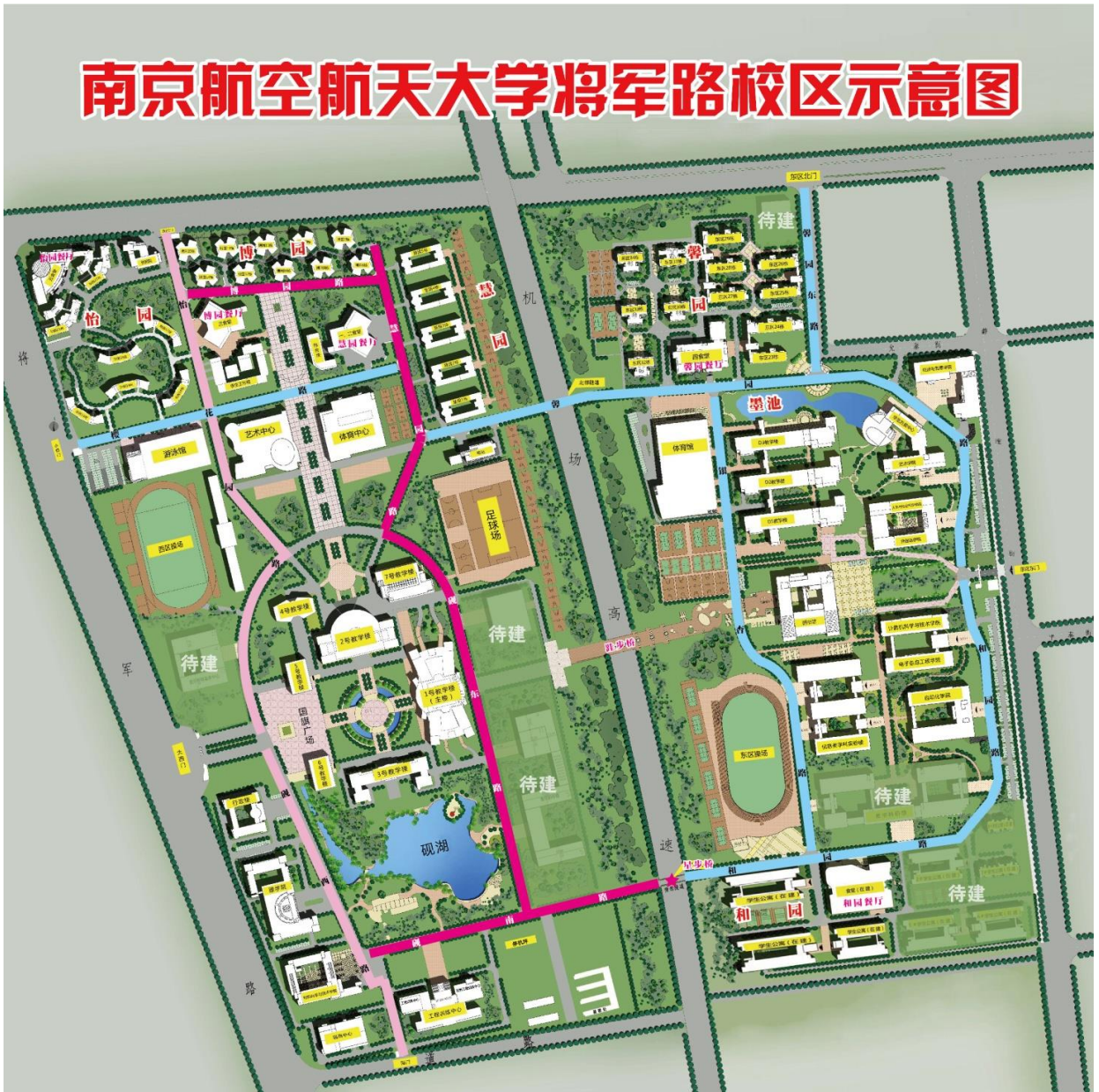
将军路校区整体布局图